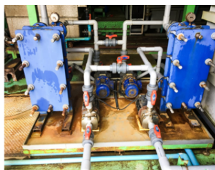
プレート式熱交換器