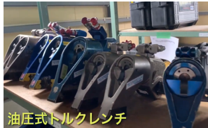
油圧式トルクレンチ